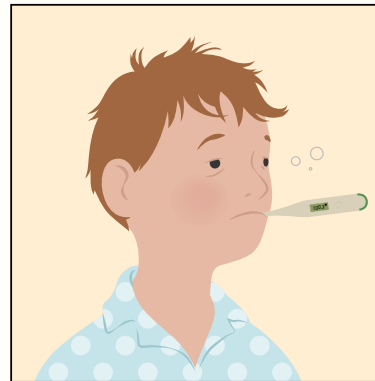
如果感覺不舒服， 請留在家裡